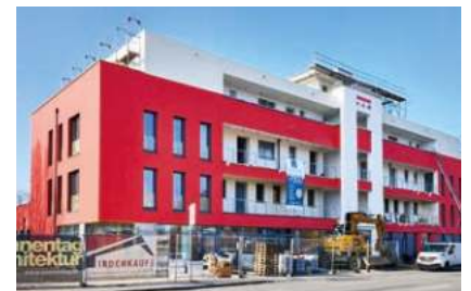
VGW-DIENSTLEISTUNGSZENTRUM Kreissparkasse eröffnet Filiale Seite 4