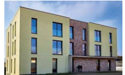
EINWEIHUNG DER TAGESPFLEGE im Riedäcker Seite 2