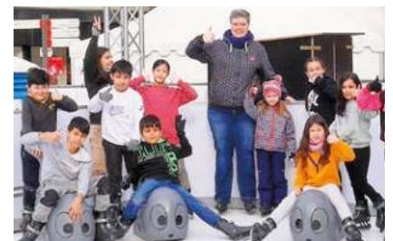
DIE EISBAHN KOMMT WIEDER Mit der VGW sparen! Seite 3